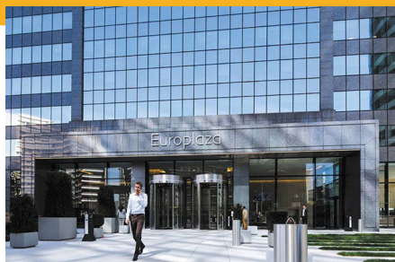
Tour Europlaza - La Défense